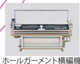
ホールガーメント横編機

島精機製作所様による 編み機の展示 や デザインシステムのデモ も開催いたします。