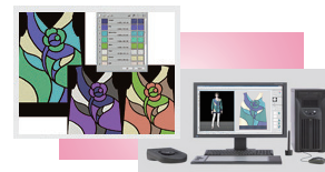
デザインシステム

ホールガーメント横編機を 実際に展示していただきます。 この機会に是非ご覧ください。