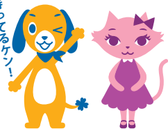
ボーケンくん シルクちゃん