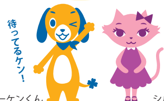
ボーケンくん シルクちゃん

上記の内容についてご不明な点等ございましたら、こちらまでお問い合わせくださいますよう、お願い申し上げます。