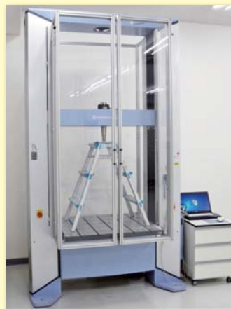
精密万能試験機オートグラフ

納期・費用につきましては、製品や素材により異なります。詳しい検査項目、料金につきましてはお気軽にお問い合わせください。