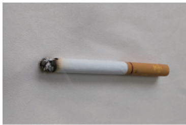
タバコ火を静置した様子

例：実際の製品にタバコ火を静置し、その燃焼の程度を確認。 (16 CFR 1610/1632/1633、CA TB 116/117 等)