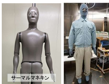
サーマルマネキン